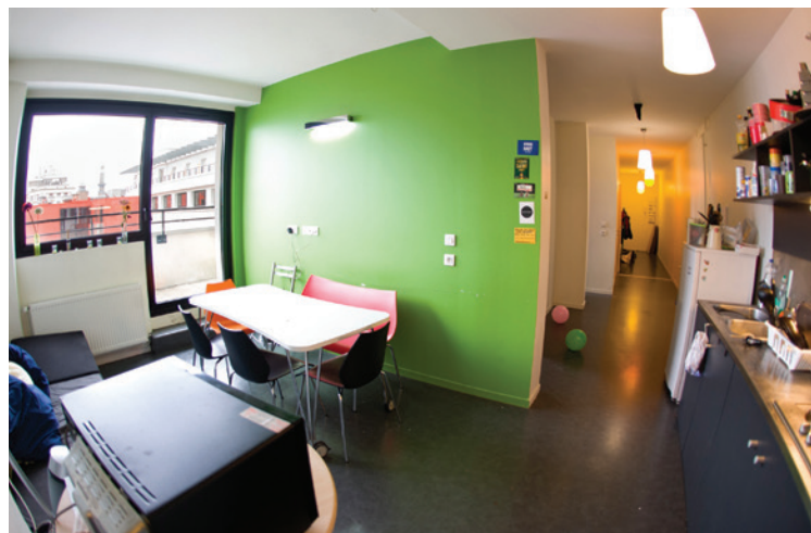
Colocation à la Maison-des-Étudiants (CROUS)

Des tentatives d'escroquerie visent chaque année des étudiants. Méfiez-vous des annonces trop alléchantes, privilégiez les communications via les plateformes de location (qui peuvent contrôler les contenus) et n'envoyez pas d'argent à distance sans avoir signé de contrat de location au préalable. Ces risques sont moins élevés dans les résidences.